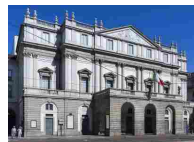
TEATRO ALLA SCALA