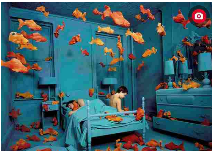
Sandy Skoglund: Revenge of the goldfish, 1981 color photograph approx. image size cm 68.75 x 87.5 ca. Courtesy: Paci contemporary gallery (Brescia ? Porto Cervo, IT) - RIPRODUZIONE RISERVATA