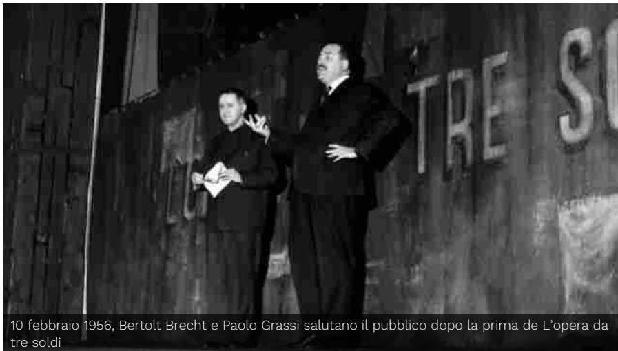
10 febbraio 1956, Bertolt Brecht e Paolo Grassi salutano il pubblico dopo la prima de L'opera da tre soldi

In mostra a Palazzo Reale libri, documenti, immagini, filmati, oggetti, quadri, in un'atmosfera magica, legata al Piccolo, alla Scala e alla piazza urbana. La mostra si divide in cinque sezioni ed è anticipata da un Prologo Familiare , un percorso attraverso foto, documenti, ritratti di Paolo Grassi e di alcuni capitoli della sua vita privata. Tra le sezioni: Costruzione di un progetto. Paolo Grassi prima di Paolo Grassi ; Al Piccolo Teatro con Giorgio, Nina e gli altri e Un teatro fuori le mura . La direzione solitaria, sui due tempi trascorsi da Grassi al Piccolo Teatro. Gli spettacoli, la politica, il suo rapporto con Goldoni, Brecht, Bertolazzi, Pirandello, Strehler, Eduardo De Filippo e altri.