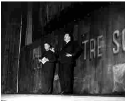
Paolo Grassi e Bertold Brecht.

innovazioni che hanno fatto scuola. Un esempio è la prima diretta televisiva in mondovisione il 7 dicembre 1976 di un'opera lirica, l'Otello di Verdi con la regia di Zeffirelli. Anche durante gli anni di presidenza della Rai, Grassi fu un innovatore, la "terza rete" divenne di fatto, il canale culturale pubblico. È importante ricordare che Grassi implementò la produzione di film e sceneggiati televisivi poi premiati nei festival più significati (su tutti: L'albero degli zoccoli di Olmi, Padre padrone dei Taviani, Molière di Ariane Mnouchkine, Gesù di Nazareth di Zeffirelli). Segnati dalla malattia, gli ultimi anni della sua carriera sono caratterizzati dal ritorno all'editoria, sua prima passione.